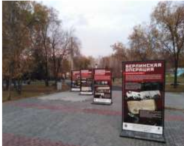
Информационно-стендовая выставка на территории парка «Сада Победы»

Членами актива музея проводится большая исследовательская работа: