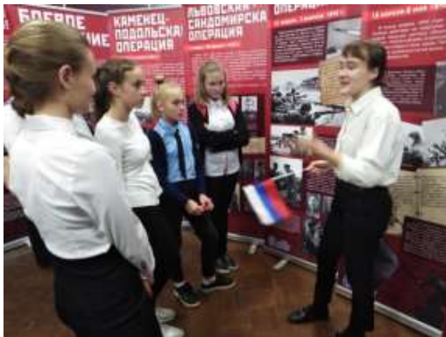
«Судеб связующая нить» в ДПШ им. Крупской

4. В 2017 г. создана большая передвижная выставка, освещающая боевой путь бригады «Нам дороги эти позабыть нельзя». Она неоднократно использовалась при проведении городских мероприятий патриотической направленности.