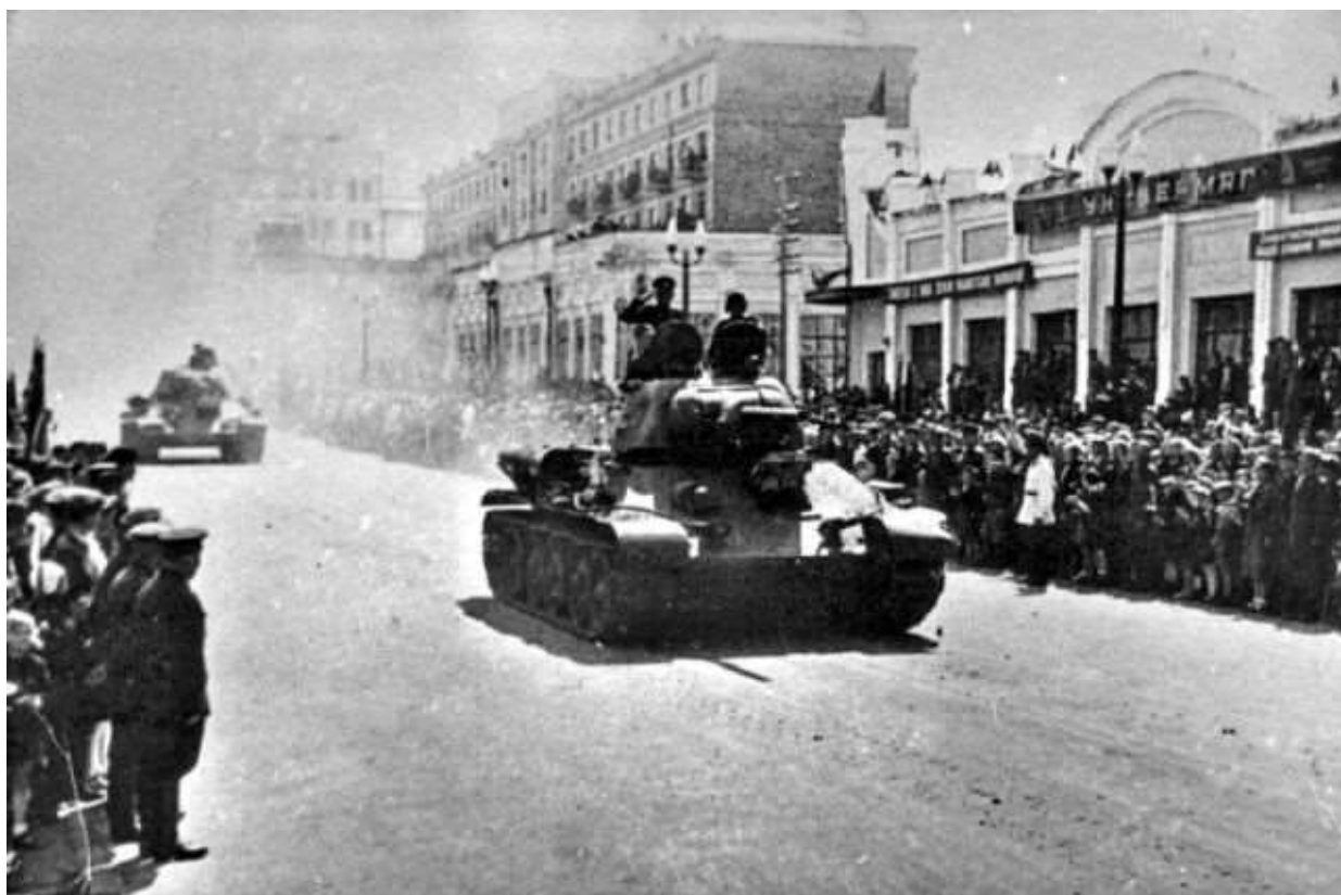
Парад 63-й Челябинской танковой бригады Уральского добровольческого танкового корпуса после принятия наказа от трудящихся Урала на улице Кирова

Добровольцы были лучшими представителями коллектива заводских рабочих. Понятно, что всех добровольцев отпустить на фронт было невозможно, так как это нанесло бы ущерб производству. Поэтому проводился специальный отбор. Собранные на производстве комиссии нередко отбирали по одному из 15–20 достойных кандидатов с условием, чтобы коллектив рекомендовал, кем заменить уходящего на фронт. На рабочих собраниях рассматривался вопрос участия того или иного кандидата в боевых действиях, возможность его отрыва от производства. Из 23-х тысяч заявлений с просьбой о зачислении их в добровольческий танковый корпус отобрано было 1 023, в том числе с Челябинского тракторного завода 300. Приказом Народного комиссара обороны от 11 марта 1943 года корпусу было присвоено наименование – 30-й Уральский добровольческий танковый корпус.